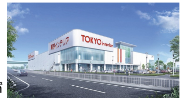
◎ 東京インテリア家具名古屋本店