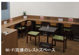
Wi-Fi完備のレストスペース

愛媛県松山市に本社を置き、四国地区と広島・山口県内にSMを展開する(株)フジが、広島市中区小網町7番4号に「フジ小網店」を3月6日(金)オープンさせた。